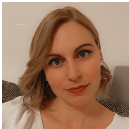
RegionalMedien Tirol RegionalMedien Tirol GmbH