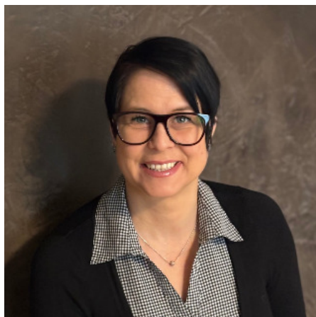
Iris Kummer RegionalMedien Kärnten RMK Regionalmedien Kärnten